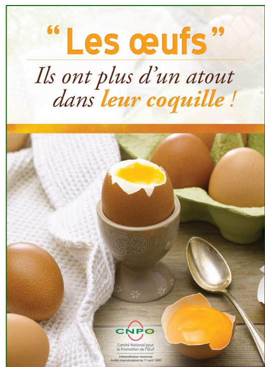
Le livret du CNPO

Dans toute la France, des dizaines de centres de production d'œufs vont localement livrer des milliers d'œufs aux associations caritatives de proximité dans le cadre de la Journée Mondiale de l'Œuf. Cette opération s'inscrit dans un contexte économique difficile pour bon nombre de Français, qui doivent souvent se tourner vers les associations pour maintenir une alimentation équilibrée. Cette démarche solidaire permet de confectionner des milliers de repas pour les personnes défavorisées.